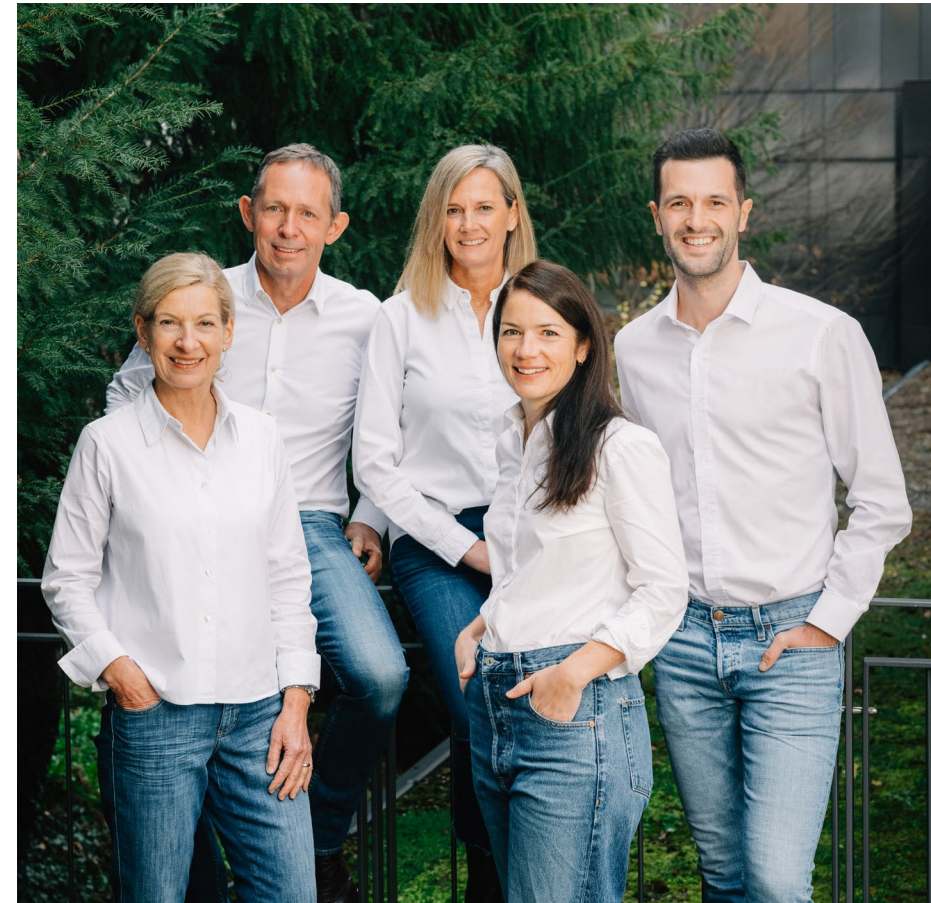
L'équipe de la Clinique Pancréas Suisse

Dès le premier jour postopératoire, un(e) physiothérapeute passe chez vous pour poursuivre la thérapie respiratoire. Vous recevrez des exercices et des instructions adaptés à votre situation. Pendant la phase aiguë, les exercices sont effectués quotidiennement avec vous afin de vous aider à retrouver une autonomie complète.