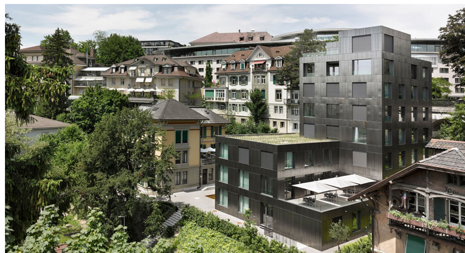
Clinique Pancréas Suisse / Haus von Rodt et Hirslanden Klinik Beau-Site

Le jour de votre admission, vous découvrirez les premiers exercices de respiration. Vous les apprenez lors d'une instruction respiratoire par le ou la physiothérapeute.