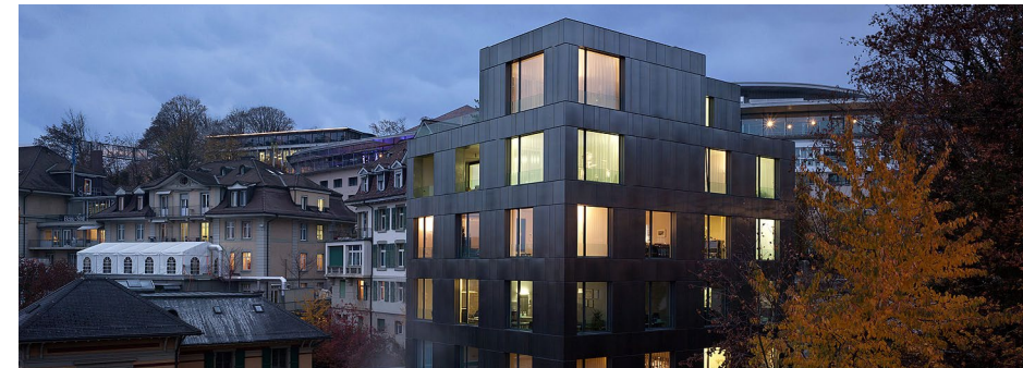
Clinique Pancréas Suisse / Haus von Rodt

Clinique Pancréas Suisse / +41 31 335 39 39